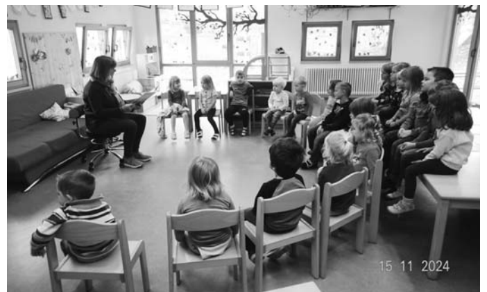
Text: A.Vollmer