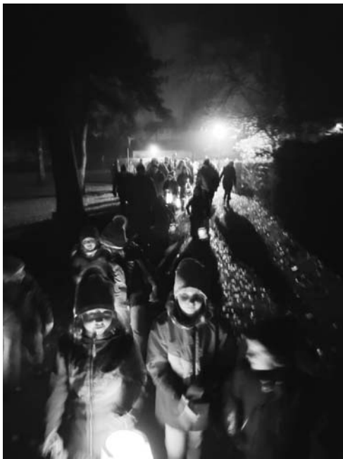
Text: A.Vollmer Bilder: P.Mogg, K.Diener