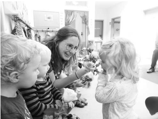
Text: A. Vollmer