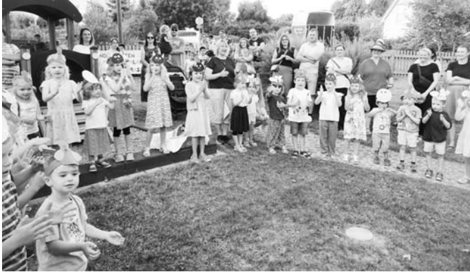
Text: J. Brucker

An dieser Stelle bedankt sich das Kindergarten-Team sehr herzlich bei allen Eltern für die Salatspende, beim Elternbeirat für die Grillstation und allen Helfern, die beim Auf- und Abbau tatkräftig unterstützt haben und bei allen Eltern, Geschwisterkinder, Omas und Opas, dass Sie so zahlreich erschienen sind.