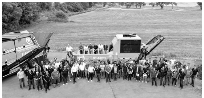
Abschlussfoto mit allen Teilnehmern und Beteiligten der WILLIBALD Maschinisten-Schulung 2023

Schon jetzt freuen sich viele Teilnehmer und das Unternehmen WILLIBALD auf die nächste Maschinisten-Schulung, die dann vermutlich im Jahr 2025 stattfinden wird.