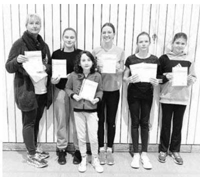
Bericht: Edgar Utz

Das Sportabzeichen Team des TSV erwartet dich und freut sich auf viele Teilnehmer