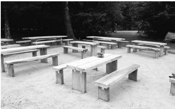
Bericht: Edgar Utz

Auf eine schöne Maiwanderung mit Euch freuen wir uns riesig!