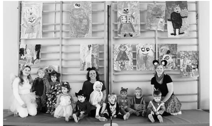
Fotos: Befreiung und Bäregruppe, Frau Binder Foto: Mäusegruppe, Frau Röhm