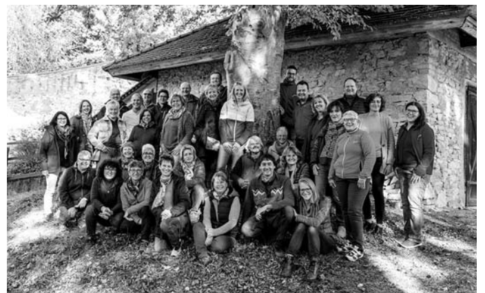
Gruppenfoto Herbstmeditation 2022

Der Eintritt zu den Konzerten ist frei. Spenden für einen gemeinnützigen Zweck sind willkommen.