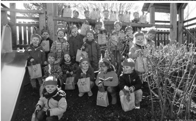
Text: Braun A.