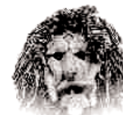
NARRENVEREIN WaldGoischer e.V.

Wir danken im Voraus für Ihre Unterstützung und bitten Sie das Alteisen bis zum 07. November herzurichten.