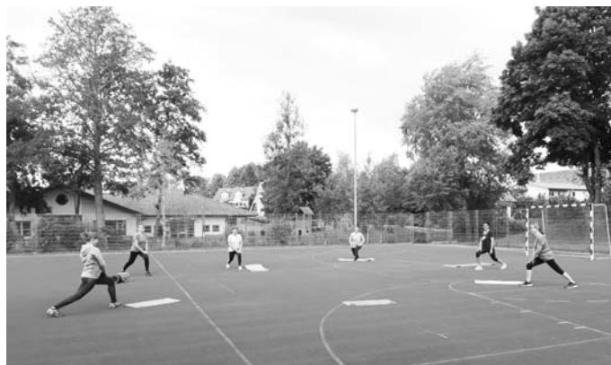
Bemerkung: Bericht von Edgar Utz