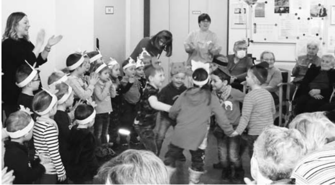
Bilder: Frau Vollmer

Wir Danken dem Haus St. Bernhard für die leckere Überraschung und die Zeit, die wir gemeinsam verbringen durften!