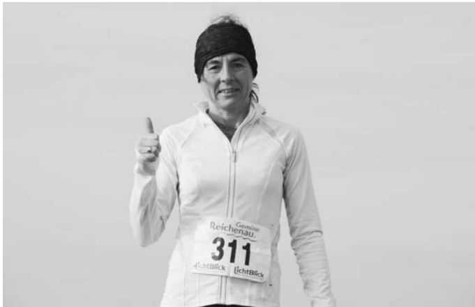
Bericht: Edgar Utz