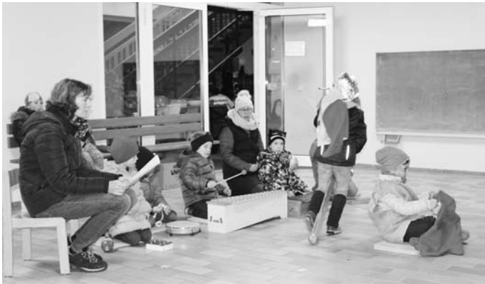
Bilder: Verena Stauß