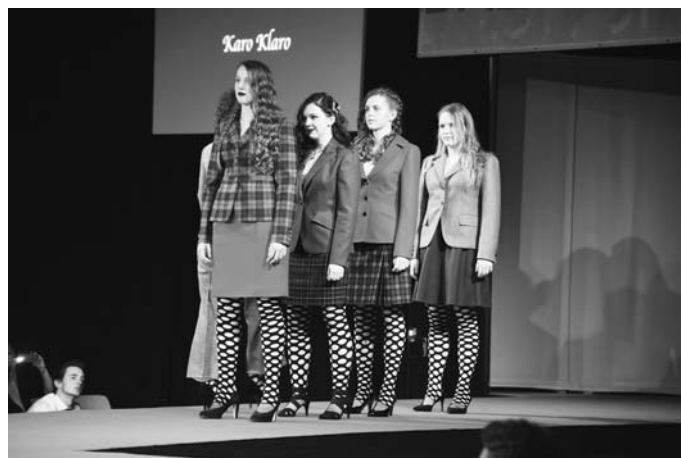
Modenschau 2019 in der Heimschule Kloster Wald

Meisterinnen und Meister begleiten die Auszubildenden mit großem Engagement während der gesamten Ausbildungszeit. Gemeinsam werden die Lossprechungsfeiern und die Modenschau organisiert.